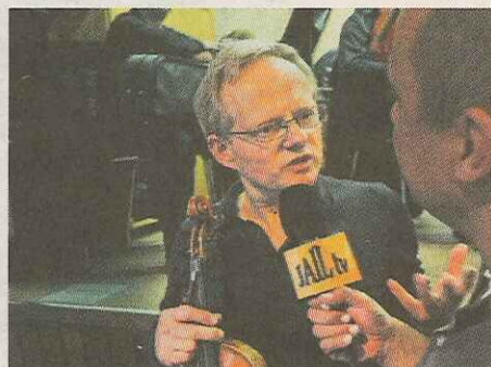
Gullit van Jail-tv doet een interview.