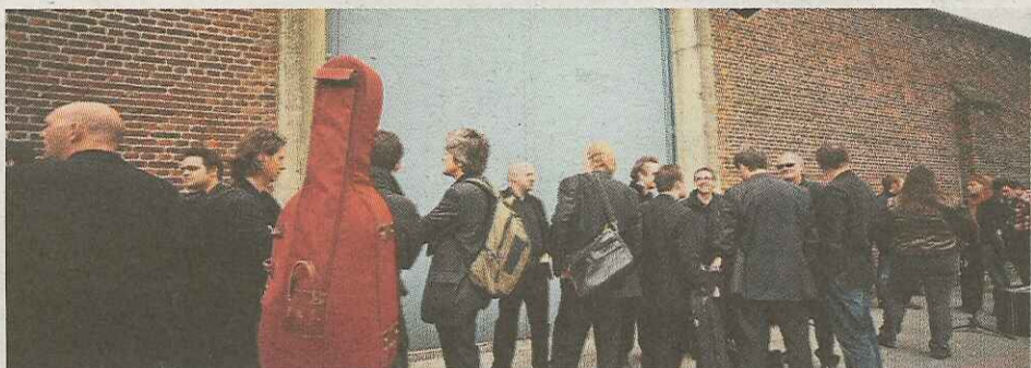
Met z'n allen tegelijk naar binnen.

Om ook mensen te bereiken die niet de kans hebben om naar een gewoon optreden te gaan, trokken de muzikanten van de Filharmonie vrijdag naar de Mechelse gevangenis. Klassiek achter tralies.