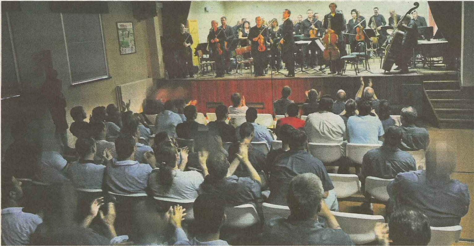
Na afloop van het concert stijgt er een enorm applaus uit de zaal op.

Terwijl de muzikanten inspelen, komt het publiek het theaterzaaltje binnen. Vooral jonge gasten, allemaal in blauw overhemd. Op het podium kijken de muzikanten in