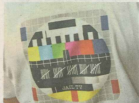
De redactie van Jail-tv heeft eigen t-shirts